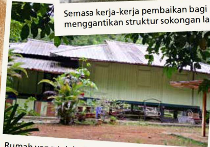
Rumah yang telah siap menjalani kerja-kerja pembaikan