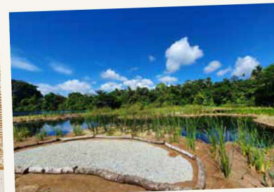
Tanah Paya Terapung yang baru ditanam dengan tumbuh-tumbuhan pada jarak yang sesuai dan ciri-ciri seperti balak dan batu kerikil untuk hidupan liar

Dengan kejayaan projek perintis ini, kami meneruskan langkah selanjutnya untuk memasang lebih banyak lagi sistem Tanah Paya Terapung dan pelantar untuk burung pucung bersarang. Sistem Tanah Paya Terapung mempunyai tumbuh-tumbuhan serta ceruk dan tenggeran. Kami berharap usaha ini akan terus meningkatkan bio-diversiti di Pekan Quarry ini.