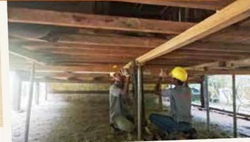
Semasa kerja-kerja pembaikan bagi menggantikan struktur sokongan lantai

NParks telah membuat kerja pembaikan bagi mengukuhkan struktur rumah No. 760 demi keselamatan penghuninya.