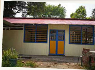
Setelah kerja-kerja pembaikan pada bulan November 2019

NParks telah membuat kerja pembaikan bagi mengukuhkan struktur rumah No. 760 demi keselamatan penghuninya.