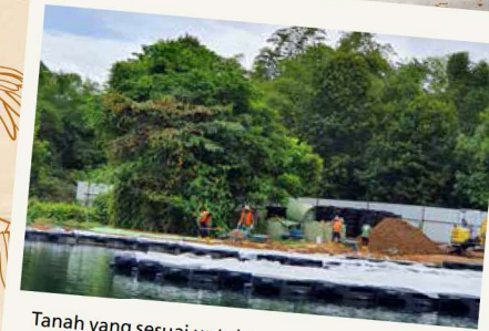
Tanah yang sesuai untuk tumbuh-tumbuhan diletakkan di atas pelantar terapung kosong yang akan digunakan untuk membina Tanah Paya Terapung yang baharu

Terletak berdekatan dengan Main Village, Pekan Quarry merupakan salah satu kuari yang terbiar di Pulau Ubin. Terdapat banyak burung pucung jenis Grey Herons (Ardea cinerea) yang menjadikan kuari ini tempat bertenggek. Burung-burung pucung dahulu kalanya membina sarang di atas pokok-pokok yang mengelilingi pinggiran kuari. Namun, burung-burung ini tidak lagi membina sarang di pinggiran kuari ini kerana paras air yang semakin tinggi.