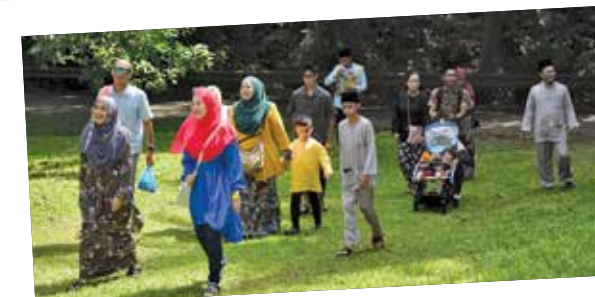
Selamat kembali kepada bekas penduduk (serta orang tersayang mereka) ke Kampung Sungei Durian!