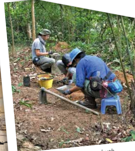
Pasukan arkeologi menyiasat sebuah tandas semasa era Perang Dunia II