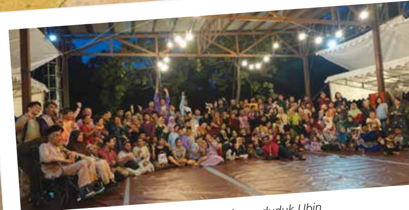
Selamat Hari Raya Aidilfitri daripada waris penduduk Ubin

Ia merupakan sesuatu yang sangat menyeronokkan apabila menyaksikan ramai kawan dan jiran dapat bersua dan berkongsi perkembangan terkini selepas tidak bertemu selama bertahun-tahun. Berduyun-duyun bekas penduduk Pulau Ubin telah pergi ke kampung Melayu bersempena dengan perayaan itu. Dengan aturan istimewa yang telah dibuat untuk 'bumboat' dan teksi percuma, bekas penduduk menyusun langkah mereka untuk ke kampung Melayu bagi meraikan acara tersebut. Ucapan istimewa ditujukan khas kepada Accessible Ubin kerana telah memastikan rakan-rakan kita yang berkerusi roda juga dapat menyertai acara ini!