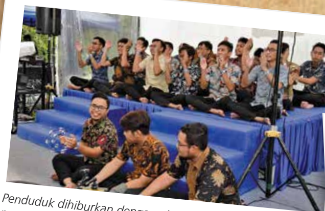
Penduduk dihiburkan dengan alunan suara daripada persembahan Dikir Barat kami.

Sebagai penutup kepada perayaan tersebut, semua orang telah berkumpul di Kawasan Perhimpunan untuk pesta gemilang ini di bawah sinaran lampu-lampu putih. Pengalaman ini menggamit memori bagi ramai orang. Kami juga berasa bersyukur kerana dapat menikmati jamuan makan di bawah sinaran bulan purnama pada malam itu!