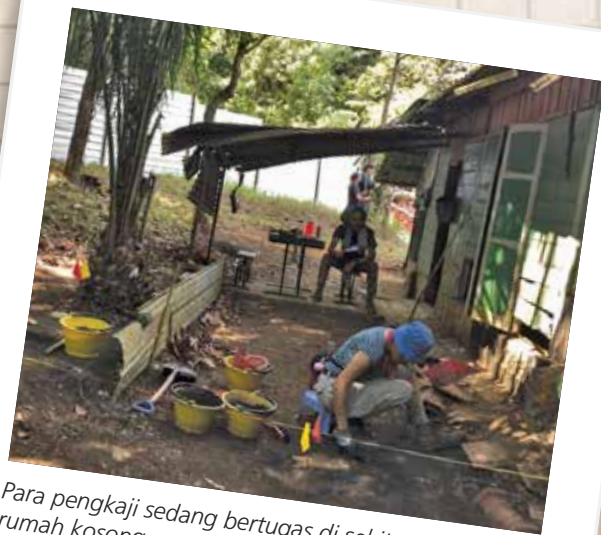
Para pengkaji sedang bertugas di sekitar rumah kosong.