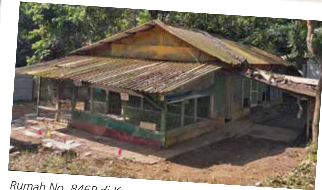
Rumah No. 846P di Kampung Melayu merupakan antara tapak yang dikaji oleh pasukan tersebut

Pasukan itu ingin meneroka interaksi antara penghuni rumah dengan persekitaran di pulau ini. Justeru, pasukan tersebut telah memilih sebuah rumah kosong diperbuat daripada kayu yang bersaiz satu tingkat iaitu rumah No. 846P di Kampung Melayu untuk mempelajari tentangnya. Kajian itu termasuk merakam dengan terperinci rumah tersebut dan kawasan sekitarnya, serta corak tentang pelupusan sampah domestik dan sisa makanan. Sampah dapur yang ditemui memberikan gambaran mengenai pemakanan penduduk pada waktu dahulu.