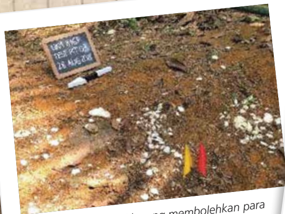
Sisa makanan seperti kerang membolehkan para penyelidik mengkaji jenis pemakanan penduduk kampung pada waktu dahulu.