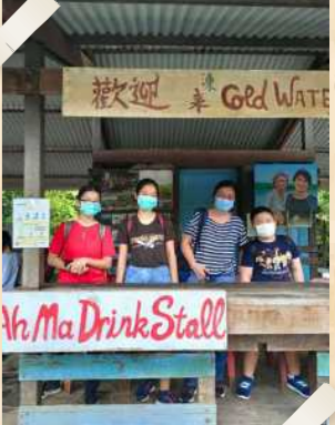
ஆ மா பானக் கடைக்கும் பங்கேற்பாளர்கள் சென்றனர்

இந்தப் பயிலரங்கு, பங்கேற்பாளர்களிடையில், குறிப்பாகப் பிள்ளைகளிடையில், நல்ல வரவேற்பைப் பெற்றது. பங்கெடுத்த பிள்ளைகளில் பலரும் தீவுக்கு முதல் முறையாக வருகை அளித்திருந்தனர். "சதுப்புநிலக் கலையின் கதை", "உபினின் பாதுகாக்கப்பட்ட உயிரினங்களின் ஓவியம்", "என் உபின் கோட்டோவியம்" போன்ற எதிர்காலத்தில் வரவிருக்கும் பயிலரங்குகளில் பங்குகொள்ளவும் அவர்கள் ஆர்வம் காட்டினர்.