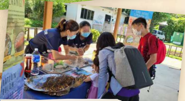
செக் ஜாவாவில் காணப்படும் பல்வேறு வகையான கடல் உயிரின வகைகளைப் பொதுமக்களுக்கு அறிமுகப்படுத்தும் யங் நௌடிஸ் தொண்டுமியர்கள்