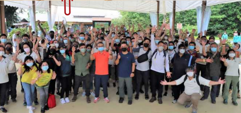
அமைச்சர் டெஸ்மண்ட் லீ மற்றும் சிறப்பு விருந்தினரான அமைச்சர் எட்வின் தொங் சிறப்பித்த உபின் தினம் 2022

2022 ஜூன் 25 அன்று உபின் தினம் அனுசரிக்கப்பட்டதோடு, பெஸ்டா உபின் ஒரு நிறைவுக்கு வந்தது. சிறப்பு விருந்தினரான சமூக, கலாசார, இளையர் அமைச்சர் எட்வின் தொங், தீவின் கிராமவாசிகளின் நலனுக்காகப் பற்பல திட்டங்களை அறிவித்தார். வயதானவர்களுக்கான தனிப்பட்ட எச்சரிக்கை பொத்தான்கள், கிராமத்தின் மின்சாரத் தேவைகளில் 90 சதவீதத்தை வழங்கும் விரிவாக்கப்பட்ட சூரிய மின்சக்தித் தொகுப்பு, தீயணைப்பு வசதிகளான தீயணைப்பு நர்க்குழாய்கள் மற்றும் குழாய்ச்சுருள்கள் ஆகியவை இதில் உள்ளடங்கும். உபின் தீவில் உயிரினங்களை மீட்பதிலும் வாழ்விடத்தை மேம்படுத்தும் முயற்சிகளிலும் அடைந்திருக்கும் முன்னேற்றங்களையும் அமைச்சர் அறிவித்தார். இதில் நீலத்தொண்டை தேன் உண்ணியின் வெற்றிகரமான கூட்டைதல், தீவில் சிறிய விசில் வாத்தின் முதல் முதலான இனப்பெருக்கம் ஆகியவை ஆவணப்படுத்தப்படுவதும் உள்ளடங்கும்.