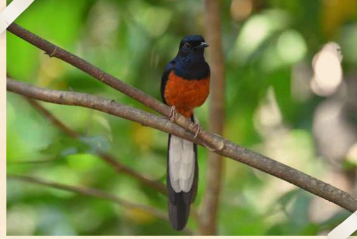
வெள்ளைவால் ஷாமா

வெள்ளைவால் ஷாமா ( கோப்ஸிகஸ் மலபாரிகஸ் ) என்பது இனிமையான குரல்கொண்ட ஓர் அழகான பாடும் பறவையாகும். இது இப்போது உபின் தீவில் பரவலாகக் காணப்படும் ஒரு பறவையாகத் திகழ்கிறது. இந்தப் பறவைகளின் வாழ்விடங்களை இணைப்பதற்காக மேற்கொள்ளப்பட்ட காடு சீரமைப்பு முயற்சிகளின் பலனாகக் காட்டுப் பகுதிகளுக்கிடையே அதிகரித்திருக்கும் தொடர்புகள் இதற்குக் காரணம்.