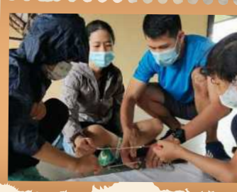
உபின் தீவில் உள்ள முக்கியமான இடங்களை எப்படி வரைபடத்தில் காட்டுவது என்பதைப் பங்கேற்பாளர்கள் கற்றுக்கொள்கிறார்கள்

அதே நாளின் பிற்பகலில், உற்சாகமான பங்கேற்பாளர்களைக் கொண்ட ஒரு புதிய குழுவுக்கு, "வில்ஸ் ஃபியூச்சர்" இரண்டாவது பயிலரங்காக "மறைந்திருக்கும் புதையல்" அங்கத்தை நடத்தியது. உபின் தீவின் வரலாற்று மற்றும் கலாசாரப் பொக்கிஷங்களைக் கண்டுபிடிப்பதற்காக, தீவைச் சுற்றிவரும் ஒரு சைக்கிள் பயணத்தில் ஒருங்கிணைப்பாளர்கள் பங்கேற்பாளர்களை அழைத்துச் சென்றார்கள்.