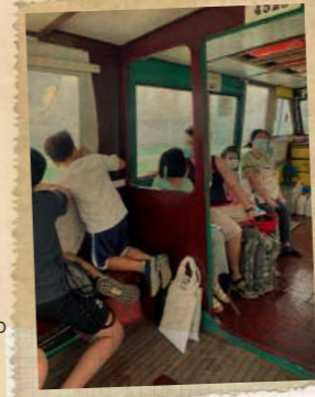
பங்கேற்பாளர்கள் முதல் முறையாக ஒரு சிறிய சரக்குப் படகில் ஆர்வத்துடன் பயணம் செய்தனர்

"செக் ஜாவாவின் கடற்கரைகளுக்கு வண்ணம் தீட்டுதல்" பயிலரங்கின் பங்கேற்பாளர்கள், "பெட்டர் டிரெய்லஸ்" ஒருங்கிணைப்பாளர்களைச் சந்திக்க, சாங்கிப் பாய்ண்ட் படகு முனையத்தை வந்தடைந்ததுடன் இந்த நாள் தொடங்கியது. பங்கேற்பாளர்கள் பலருக்கும், முதல் முறையாக ஒரு சிறிய சரக்குப்படகில் பயணம் செல்லும் அனுபவமாக இது அமைந்தது! சூரிய ஒளியில் நனைந்து, கடல் காற்றை அனுபவித்து, விரைவில் உபின் தீவை வந்தடைந்த பங்கேற்பாளர்கள், தீவின் ஊக்கமளிக்கும் இயற்கைப் பாதுகாப்புக் கதையையும் வளமான பல்லுயிரியலையும் பற்றி அறிந்துகொள்ள, செக் ஜாவா ஈரநில வருகையுடன் தங்கள் சுற்றுலாவைத் தொடங்கினர்.