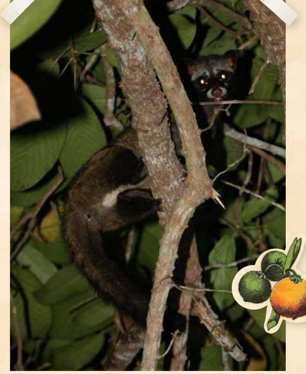
சுமத்ரா பனை புனுக்குப்பூனை

தற்போது, உபின் தீவில் காடுகளைச் சீரமைக்கும் முயற்சிகளும் உயிரினங்களின் வாழ்விடத்தை மேம்படுத்தும் திட்டங்களும் செயல்படுத்தப்பட்டு வருகின்றன. "ஒரு மில்லியன் மரங்கள்" இயக்கத்திற்கு ஆதரவாக, 200-க்கும் மேற்பட்ட உள்ளூர் தாவர இனங்களைச் சேர்ந்த சுமார் 30,000 மரங்கள் 2020 முதல் 2030 வரை நடப்படும்.