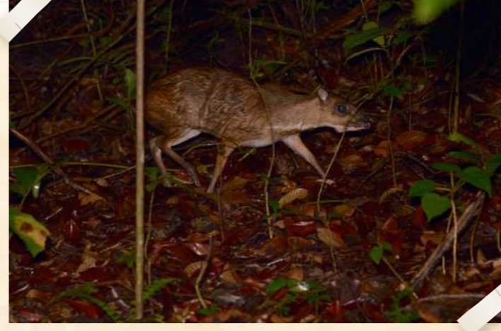
பெரிய சருகுமான்

எளிதில் தென்படாத பாலூட்டியான பெரிய சருகுமான் ( டிராசுலஸ் நாட ), உபின் தீவில் காணப்படும் ஒரே சருகுமான் இன விலங்காகும். இது தீவெங்கிலும் உள்ள காடு சீரமைப்புப் பகுதிகளின் அடிவாரங்களில் காணப்படுகிறது. சருகுமான் பொதுவாகத் திறந்தவெளிப் பகுதிகளில் காணப்படுவதில்லை. எனவே, "ஒரு மில்லியன் மரங்கள்" இயக்கம், பசுமையான மேற்பரப்பு மறைப்பை உருவாக்கித்தர உதவுகிறது. இது சருகுமான்கள் சுலபமாக நடமாடுவதற்கு உதவுவதோடு, அவற்றின் எண்ணிக்கையைப் பெருக்கவும் உதவும் என நம்பப்படுகிறது.