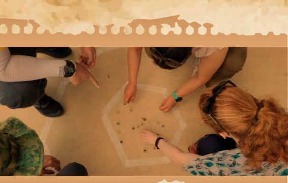
கோலி பாஞ்சாங் விளையாடுபவர்கள், எதிரணியினரின் கோலிகளை வட்டத்திற்கு வெளியே தட்டிவிட முயற்சிக்கின்றனர். அதிகமான கோலிகளை அவ்வாறு செய்பவரின் பெயர்களை அறிவிக்கிறார்

பெஸ்டா உபின் 2022, விருவிறுப்பான பலதரப்பட்ட நடவடிக்கைகளை உபின் தீவுக்கு மீண்டும் வரவேற்றது. காசிங் (பம்பரம் சுற்றுதல்), கோலி பாஞ்சாங் (கோலிகள்), பாண்டி விளையாட்டு, சாப்தே (இறகுப்பந்தை உதைத்தல்) போன்ற கம்போங் விளையாட்டுகளைப் பங்கேற்பாளர்கள் விளையாடி மகிழ்ந்தனர். சுற்றுலாக்கள் மற்றும் சமூக மலையேறும் நடவடிக்கைகள் மூலம், அவர்கள் உபினின் வாழும் மரபுடைமையில் மூழ்கினர். மேலும், உபினின் வளமான பல்லுயிரியலை எடுத்துக்காட்டிய கண்காட்சிகளிலும், வழிகாட்டியுடனான நடைப் பயணங்களிலும் கலந்து கொண்டனர். வெகுநாள்தான் எதிர்பார்த்திருந்து காத்திருந்த ஏற்பாட்டாளர்களுக்கு, பெஸ்டா உபின் மூலமாக ஒவ்வொருவரையும் நேரில் சந்திக்கும் வாய்ப்பாகவும் அது அமைந்தது.