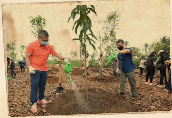
அமைச்சர் எட்வின் தொங் (இடது), அமைச்சர் டெஸ்மண்ட் லீ (வலது) ஆகியோர் 2022-ஆம் ஆண்டு உபின் தினத்தின்போது தாங்கள் நட்ட மரத்திற்கு நீர் ஊற்றுகின்றனர்

சமூகத்தின் ஈடுபாடு "ஒரு மில்லியன் மரங்கள்" இயக்கத்தின் வெற்றிக்கு சமூக ஈடுபாடு மிகவும் முக்கியம். 2020-ஆம் ஆண்டு முதல், பசுமையான எதிர்காலத்திற்கான முயற்சிகளில் 20-க்கும் மேற்பட்ட சமூகக் குழுக்களின் பங்களிப்பை உபின் தீவு ஈர்த்துள்ளது.