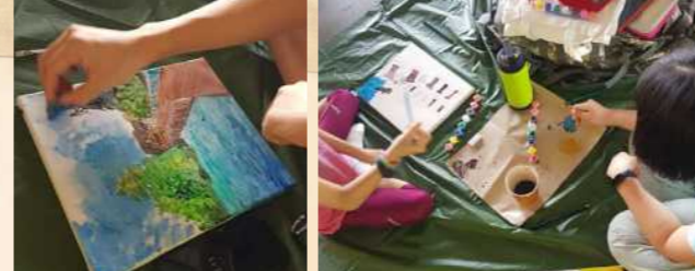
(இடது): ஒரு பங்கேற்பாளர் ஒரு பஞ்சைக்கொண்டு "செக் ஜாவாவின் கடற்கரைகளுக்கு வண்ணம் தீட்டுகிறார்"; (வலது): செக் ஜாவா ஈரநிலங்களில் தாங்கள் பெற்ற அனுபவத்தைப் பிள்ளைகளும் வரைந்தனர்

அந்த நடைப்பயணத்தை நிறைவுசெய்ய, பங்கேற்பாளர்கள் செக் ஜாவா ஈரநிலத் தடத்தில் கிடைத்த அனுபவத்தை, ஒருங்கிணைப்பாளர்களின் வழிகாட்டுதலின்கீழ், ஒரு குடும்ப ஒவியமாகத் தீட்டினர். பஞ்சுகள், முள் கரண்டிகள் போன்ற வழக்கத்திற்கு மாறான பொருட்களைப் பயன்படுத்தும் புதிய ஒவிய நுட்பங்களையும் ஒருங்கிணைப்பாளர்கள் பகிர்ந்துகொண்டனர்.