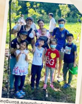
கரையோரத் தாவரவியல் ஆய்வுப் பூங்காப் பகுதியில் கிரியேட்டிவ் ஓப்ரீஸ்கூவரஸ் பே மாணவர்கள் "ஒரு மில்லியன் மரங்கள்" இயக்கத்தின்கீழ் மரங்கள் நட்டனர்

எளிதில் தென்படாத பாலூட்டியான பெரிய சருகுமான் ( டிராசுலஸ் நாட ), உபின் தீவில் காணப்படும் ஒரே சருகுமான் இன விலங்காகும். இது தீவெங்கிலும் உள்ள காடு சீரமைப்புப் பகுதிகளின் அடிவாரங்களில் காணப்படுகிறது. சருகுமான் பொதுவாகத் திறந்தவெளிப் பகுதிகளில் காணப்படுவதில்லை. எனவே, "ஒரு மில்லியன் மரங்கள்" இயக்கம், பசுமையான மேற்பரப்பு மறைப்பை உருவாக்கித்தர உதவுகிறது. இது சருகுமான்கள் சுலபமாக நடமாடுவதற்கு உதவுவதோடு, அவற்றின் எண்ணிக்கையைப் பெருக்கவும் உதவும் என நம்பப்படுகிறது.